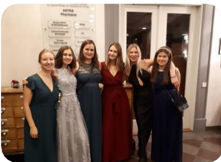
Caphé Coffein HT-19

Vad vore Farmaceutiska Studentkåren utan amöbaveckorna? Det är under dessa tre veckor som ni amöbor får chansen att lära känna varandra och introduceras till kåren, och det är vi i Amöberiet som ser till att detta blir verklighet. Våra uppgifter är bland annat att planera aktiviteterna, laga maten och framförallt att få er att känna er så välkomna som vi bara kan! Amöberiet består av en ledare, Cellkärnan, och Mitokondrier till dennes tjänst. Självklart har vi även hjälp av alla phaddrar under själva amöbaveckorna. Vi hoppas att ni ser de här veckorna som en underbar chans att umgås och introduceras till allt vad livet som farmacistudent har att erbjuda. Nu ser vi till att göra denna termins amöbaveckor till något att minnas för livet och se tillbaka på med glädje!