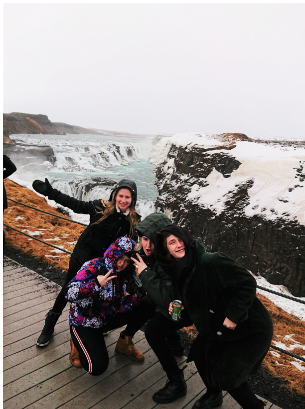
Sightseeing första dagen

Pinse är en kongress kantad av många traditioner där nya tillkommer titt som tätt, men de allra flesta sträcker sig tillbaka från början. Den första natten spenderas alltid i en stuga mitt i ingenstans, helst med tillgång till bastu för att hålla finländarna nöjda, vilket det även gjordes detta år. Efter en dag med sightseeing på Island bestod kvällen av olika lekar för att lära känna varandra lite bättre och sätta stämningen inför veckan. På tisdagen hölls som vanligt Materia där spex, lekar och pharmacanton står i fokus. Under onsdagen besöktes det traditionsenligt ett ölbryggeri vilket avslutades i en runda på Reykjaviks gator för att besöka de lokala barerna, vilket detta år avslutades lite oväntat med en dragshow. Min personliga höjdpunkt var i år (precis som alla andra år) torsdagens Nordic Night där varje land får duka upp den bästa mat och dryck som landet har att erbjuda. Det blir ofta en eller annan snaps och lakrits i alla dess former. Detta år hade vi såklart även turen att få smaka på både haj och fårhuvud från Island, samt den obligatoriska Gammeldansk. Veckan avslutades sedan med att alla fräschade till sig lite, satte på sig en kavaj eller finklänning, åt en tre-rätters middag och hade det trevligt med sång och dans ända in på de berömda småtimmarna.