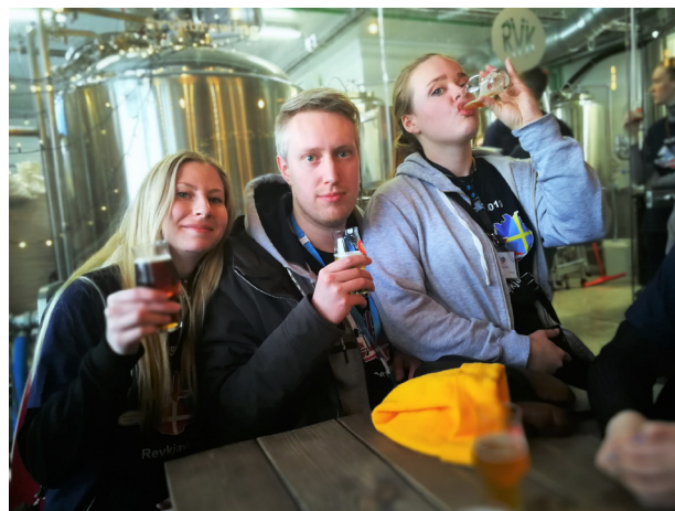
Besök och ölprovning på ett bryggeri.