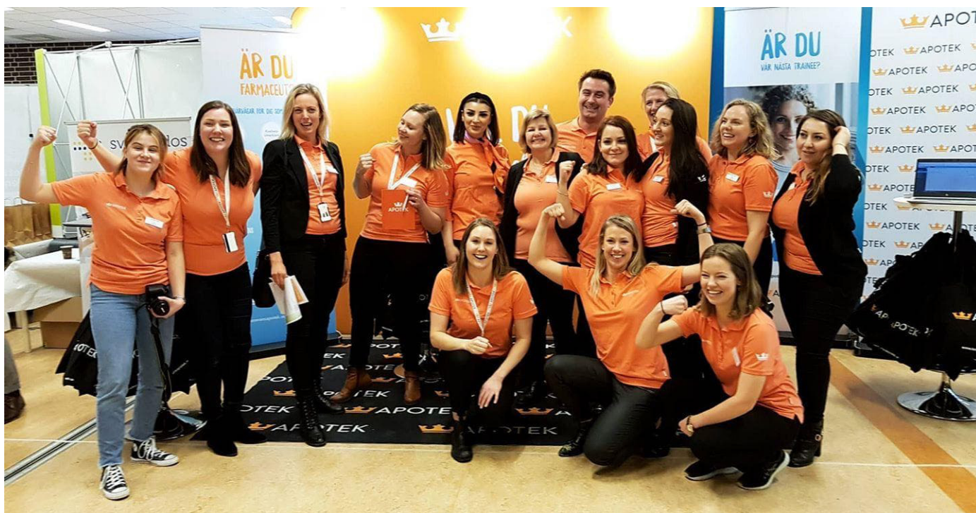
Kronans Apotek - stolt huvudsponsor av Pharmada!