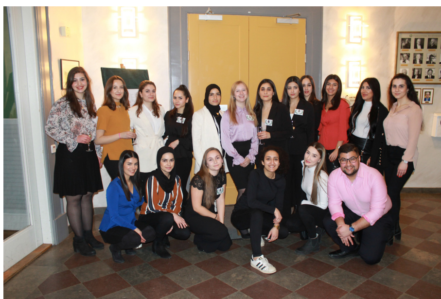
Företagsvärdar och Pharmadakommittén

Jag som projektledare vill avsluta med att tacka alla som varit en del av Pharmada 2019, såväl engagerade som deltagare och utställare. Ett särskilt tack vill jag också rikta till den fantastiska kommitté jag haft möjlighet att jobba med inför årets Pharmada, utan er hade det aldrig gått. Vi hoppas att ni alla är nöjda med årets upplaga och att lika många kommer för att ta del av Pharmada 2020!