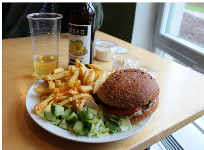
Fig. 2: Bilden visar Umamiburgaren med dipp och cider.

Burgare med följande tillbehör får 4 av 5 metoprolol.