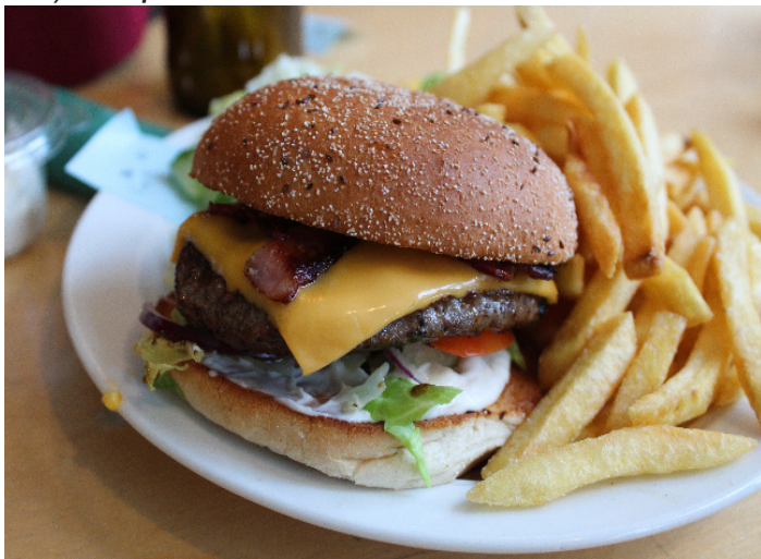
Fig. 1: Bilden visar Cheese N' bacon.

Jag måste tillstå att burgern ovillkorligen var dagens stora höjdpunkt. Dess fyllighet, koncisa konsistens och balanserade konstellation fick mina smaklökar att dansa tango. Jag kan inte ge annat än 5/5 flurbiprofen.