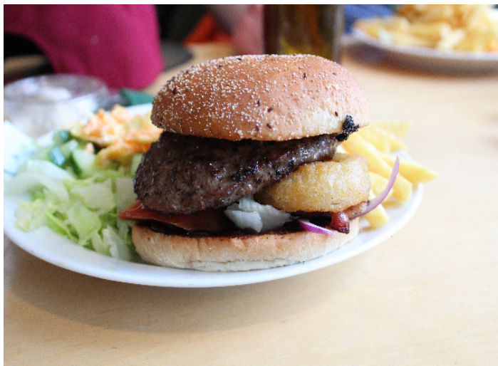
Fig. 3: Americano.

Burgare med följande tillbehör får 3 av 5 loratadin.