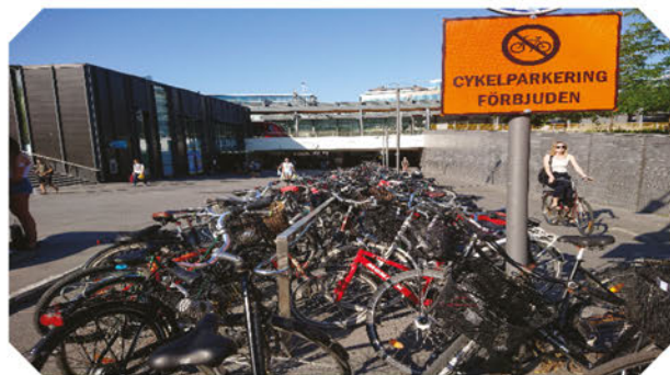
Följ lagar och regler, så är risken för böter mindre!