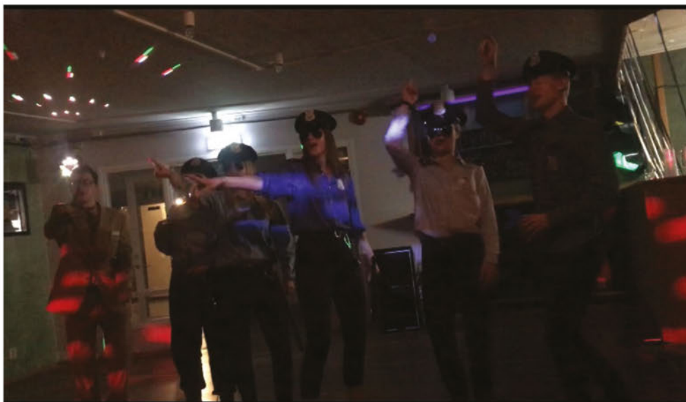
En bild från KvP-phesten HT19

Varje termin anordnar klubbverket (KvP) en tackfest för alla som varit mer och jobbat under terminens sittningar eller pubar. Vem som helst kan komma och jobba på en sittning, inga förkunskaper krävs. Så vad väntar du på? Kom och jobba och få möjlighet att gå på en av Pharmens roligaste fester. Klädsel: Precis som man vill!