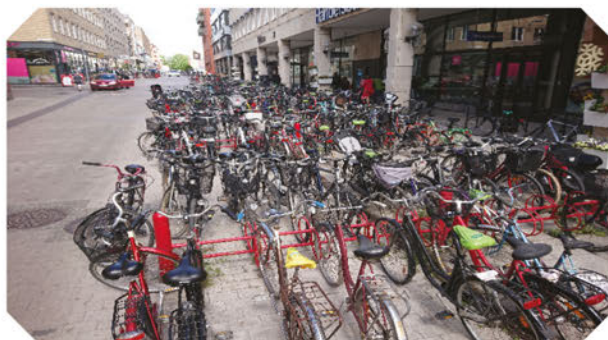
Cyklar överallt i Uppsala!