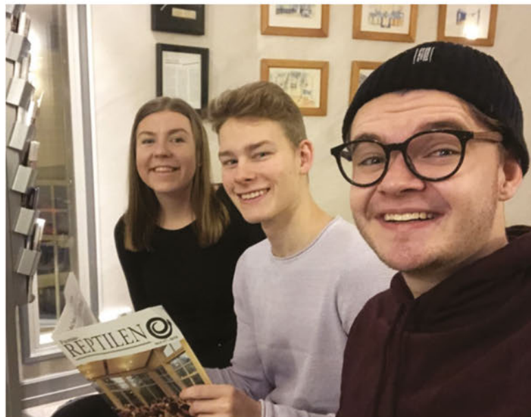
Hej amöbor, nya samt gamla läsare!

Det egna materialet i denna tidskrift får ej, helt eller delvis, publiceras utan redaktionens medgivande. Vi förbehåller oss rätten att ändra i insända manus.