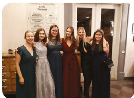
Caphé Coffeine HT-19

Vad vore Farmaceutiska Studentkåren utan amöbaveckorna? Det är under dessa tre veckor som ni amöbor får chansen att lära känna varandra och introduceras till kåren, och det är vi i amöberiet som ser till att detta blir verklighet. Våra uppgifter är bland annat att planera aktiviteterna, laga maten och framförallt att få er att känna er så välkomna som vi bara kan! Amöberiet består av en ledare, Cellkärnan, och sex stycken Mitokondrier till dennes tjänst. Självklart har vi även hjälp av alla phaddrar under själva amöbaveckorna. Vi hoppas att ni ser de här veckorna som en underbar chans att umgås och introduceras till allt vad livet som farmacistudent har att erbjuda. Nu ser vi till att göra denna termins amöbaveckor till något att minnas för livet och se tillbaka på med glädje!