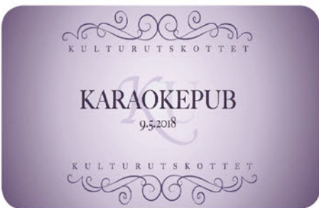
Kulturutskottet har bland annat ordnat karaoke!

För mer information, gå med i vår grupp på facebook; Farmis IdrU (idrottsutskottet). Så om ni är intresserade av att varva föreläsningar och plugg med rörelse har ni hittat rätt! Hoppas vi syns! Vänliga hälsningar, ordförande i IdrU.