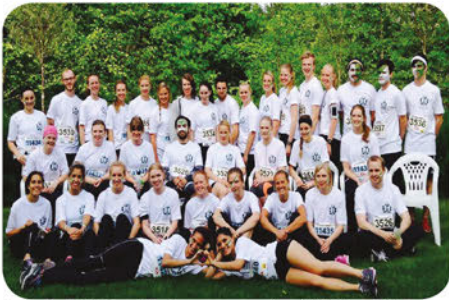
Träning är bra för kroppen och väldigt roligt!