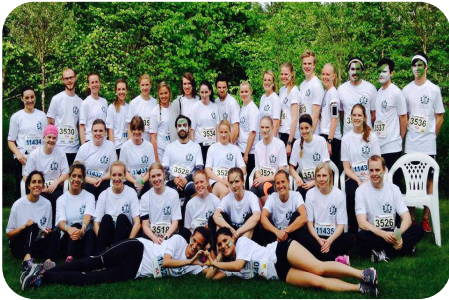
Träning är bra för kroppen och väldigt roligt!