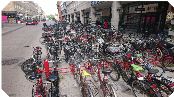
Cyklar överallt i Uppsala!

Välkommen till Uppsala och ditt nya cykelliv!