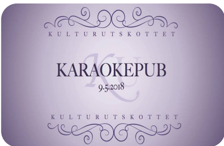
Kulturutskottet har bland annat ordnat karaoke!

Så om ni är intresserade av att varva föreläsningar och plugg med rörelse har ni hittat rätt! Hop- pas vi syns! Vänliga hälsningar, ordförande i IdrU.