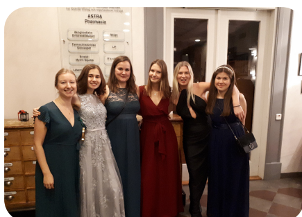
Caphé Coffeine HT-19

Vad vore Farmaceutiska Studentkåren utan amöbaveckorna? Det är under dessa tre veckor som ni amöbor får chansen att lära känna varandra och introduceras till kåren, och det är vi i amöberiet som ser till att detta blir verklighet. Våra uppgifter är bland annat att planera aktiviteterna, laga maten och framförallt att få er att känna er så välkomna som vi bara kan! Amöberiet består av en ledare, Cellkärnan, och sex stycken Mitokondrier till dennes tjänst. Självklart har vi även hjälp av alla phaddrar under själva amöbaveckorna. Vi hoppas att ni ser de här veckorna som en underbar chans att umgås och introduceras till allt vad livet som farmacistudent har att erbjuda. Nu ser vi till att göra denna termins amöbaveckor till något att minnas för livet och se tillbaka på med glädje!