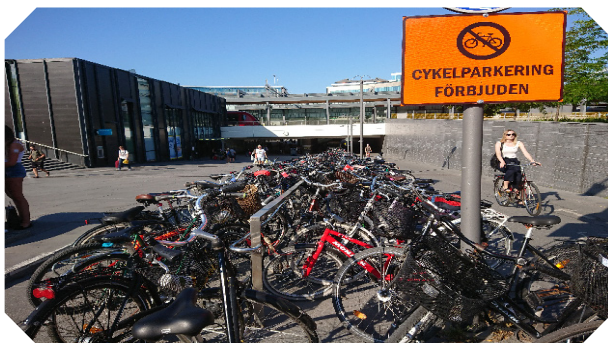
Följ lagar och regler, så är risken för böter mindre!