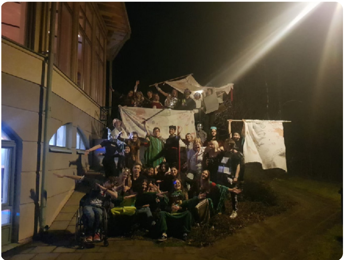
Bilder från tidigare amöbaveckor